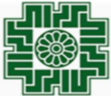
وزارت اقتصاد و امور مالیاتی اظهارنامه های مالیاتی

انکارناپذیری: فرستنده نمی تواند امضای خود را انکار نماید.